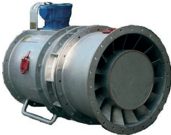
Charakterystyka wentylatora GWE-630B/18,5