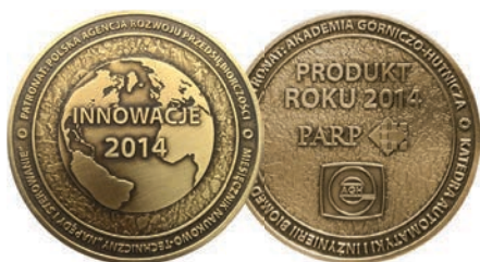
Medale: Innowacje 2014 i Produkt Roku 2014