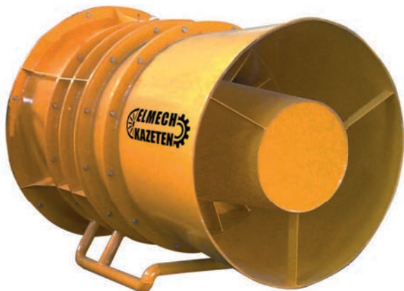
Charakterystyka wentylatora WLH-800E/1